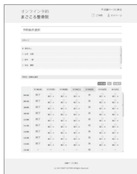
※予約画面イメージ