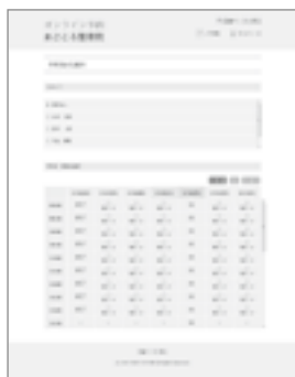
※予約画面イメージ